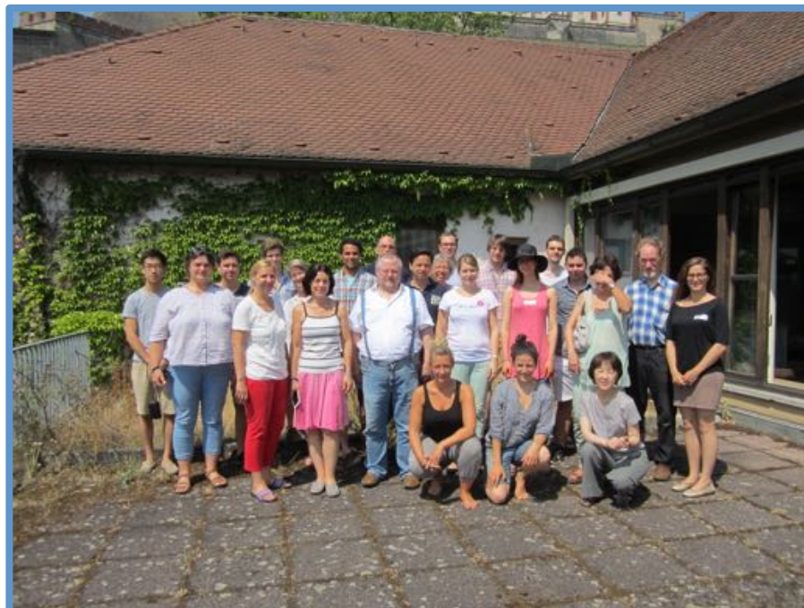
Jahrestreffen 2015 in Würzburg (BILD)