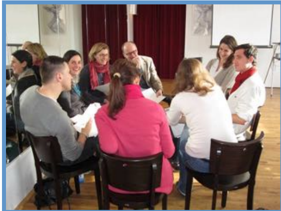
Links: Hauptauswahltraining im Januar in Berlin 2014

Hauptauswahlen am 15.-17. Januar und 22.-24. Januar in Kassel und Bad Homburg (Ehemalige als Auswähler)