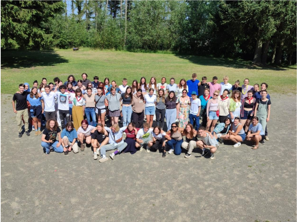
Gruppenfoto Vorbereitungstreffen 2022

Möglich macht die Durchführung ein engagiertes Freiwilligen-Team aus Ehemaligen früherer Jahrgänge, die sich schon in der Planung ganz involviert überlegen, welche Kompetenzen sie den Jüngeren mitgeben wollen. So entsteht ein Programm, das sowohl Spaß als auch Reflexion balanciert.